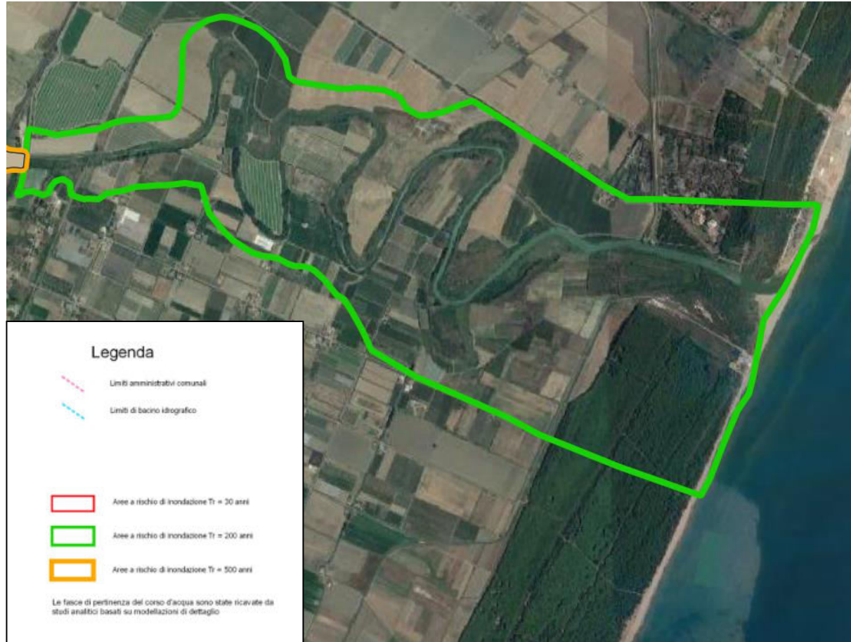
Piano Stralcio delle Fasce Fluviali – UOM Cavone UoMCode ITI024 Comuni di Pisticci (MT) e Scansano Jonico (MT)– Fiume Cavone -stralcio della carta delle fasce fluviali – Piano Vigente

AUTORITA' DI BACINO DISTRETTUALE DELL'APPENNINO MERIDIONALE Protocollo Partenza N. 3619/2023 del 07-02-2023 Allegato 1 - Class. 07.01 - Copia Del Documento Firmato Digitalmente